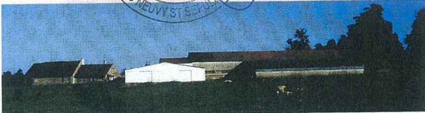
Une construction trop claire s'insère mal dans le paysage

a été signée le 20 juin 2000 sous la présidence du préfet de l'Indre.